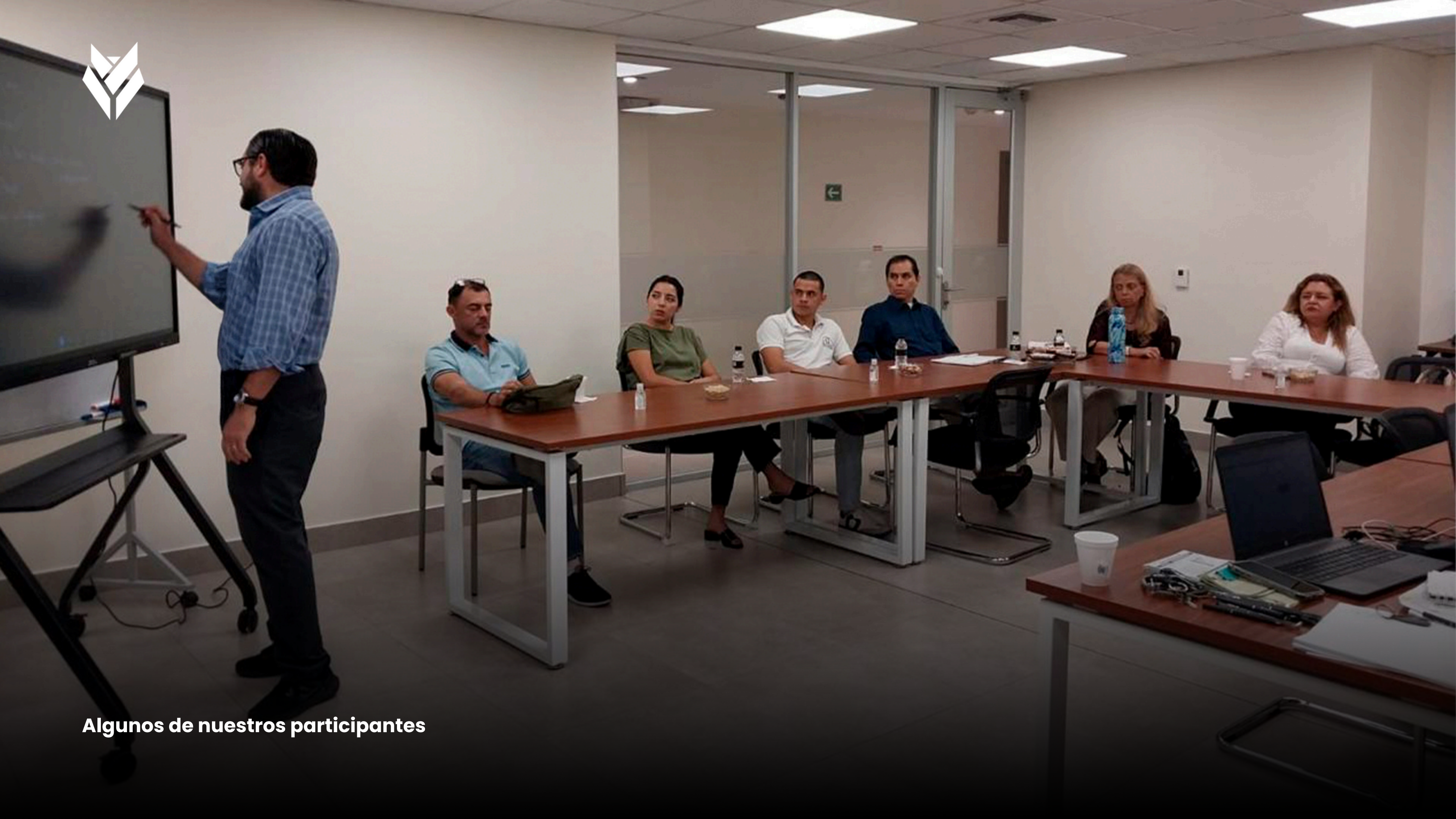
Algunos de nuestros participantes